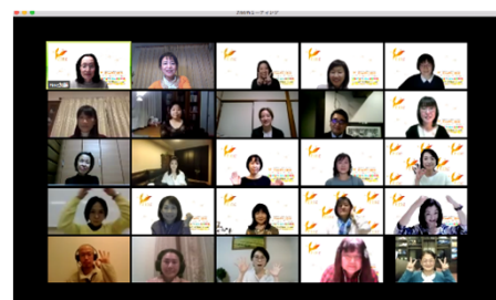
『Fine祭り2020』 不妊スペシャリストの皆さん とFineスタッフ

病院では聞きづらいこと、検査や治療のこと、医師やクリニックとのコミュニケーションの取り方、治療に関する悩みや心配ごと、疑問点など、どんなことでも気軽に相談できます。毎年、すぐ予約が埋まるほど大好評です。