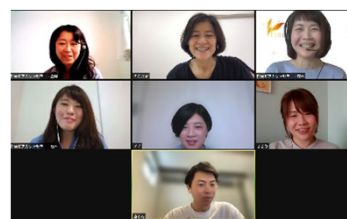
オンラインおしゃべり会のイメージ画像

おしゃべり会の参加者からは「同じ悩みを持つ人と素直な気持ちを話すことができてよかったです」「話すだけでこんなに気持ちが楽になるのだと感じました」などの声が寄せられています。