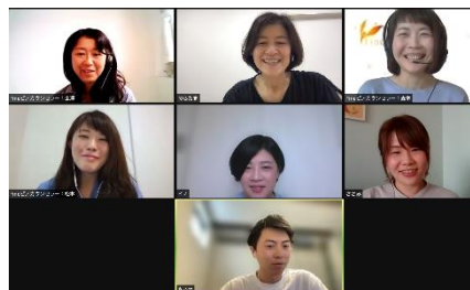
オンラインおしゃべり会のイメージ画像

おしゃべり会の参加者からは「ピアカウンセラーさんの『がまんしなくてもいい』という言葉に救われました」「治療のつらさをわかっている皆さんと話ができて気持ちが楽になりました」などの声が寄せられています。