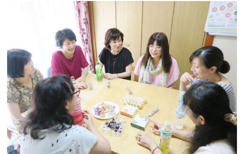
おしゃべり会のイメージ

おしゃべり会の参加者からは「初めて不妊治療の悩みを素直に人に話すことができました」「治療のつらさをわかっている皆さんと話ができて気持ちが楽になりました」などの声が寄せられています。