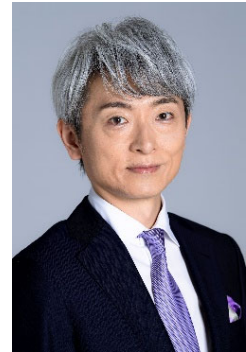
Fine名誉会員でもある登坂淳一さん (元NHKアナウンサー・タレント)